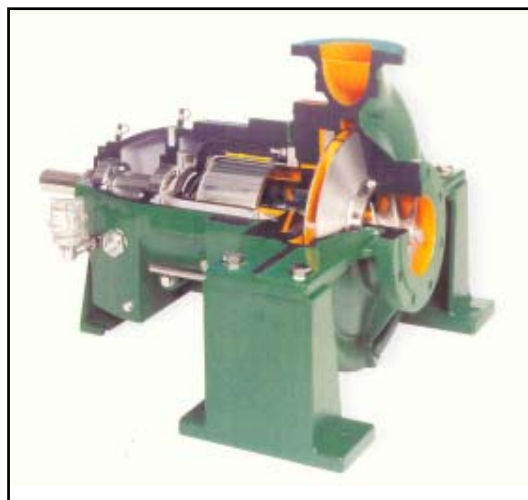
PRM enligt API 685