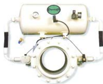
EXKOP färdig för installation